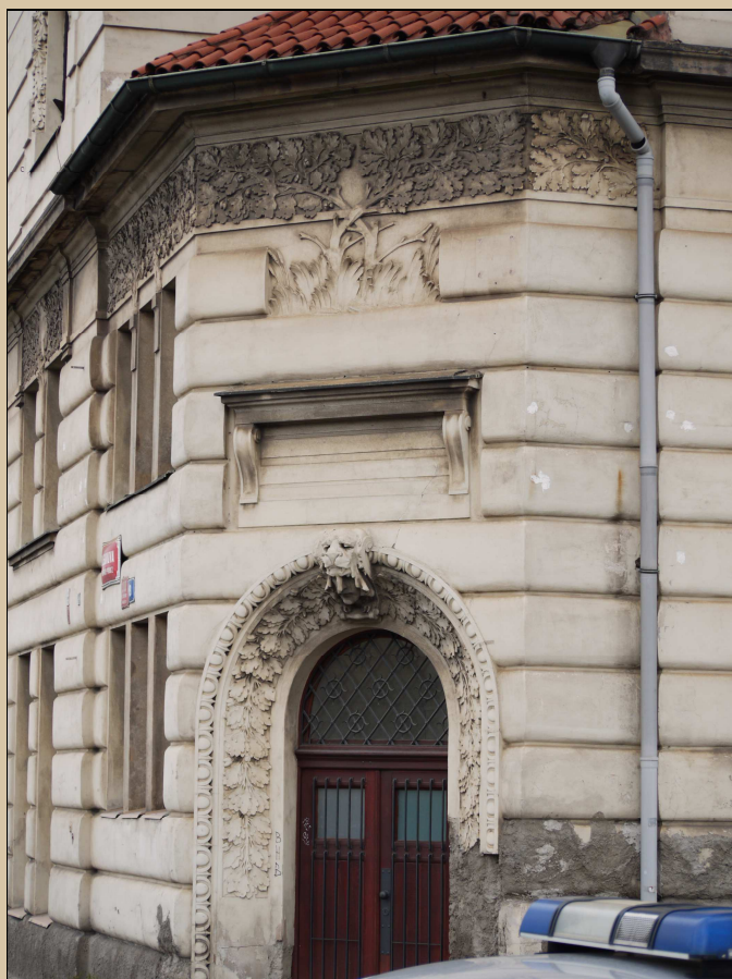
Pohled na portál