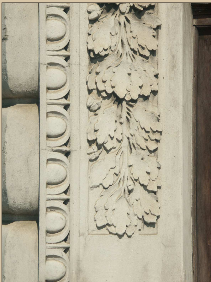
archivolta portálu zdobená vejcovcem a dubovými haluzemi